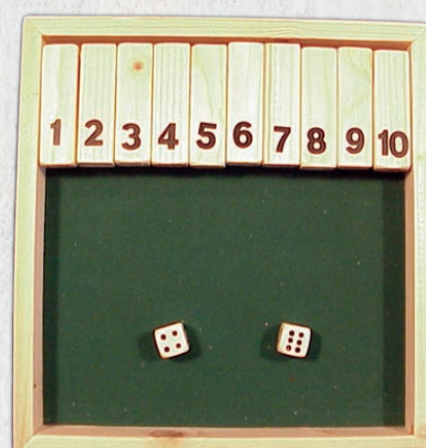
*t grote kleppenspel